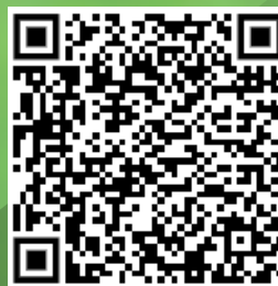
Nota de prensa