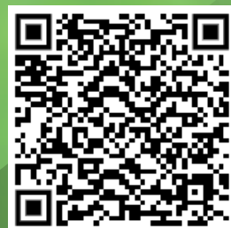
Nota de prensa